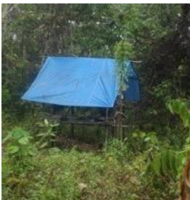
Tentje van illegale houtkappers op consessiegebied – één vonk en het bos staat in licht laaie.

Er is ook een uitstoot van jewelste op kaalgeslagen grond van rottend hout (vooral methaan - het ergste greenhouse gas) en het ontstaan op de slecht gecontroleerde consessiegronden van allerlei brandjes die met de droogte dit jaar totaal uit de hand zijn gelopen en een permanente waas over het land (én buurlanden Singapore en Maleisië) hebben verspreid, met alle gezondheidsproblemen van dien.