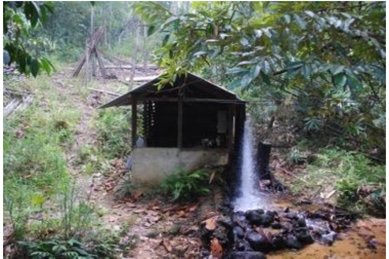
Mini-hydro-energie-centrale in oerwoud van Tembak, West Kalimantan

Veel boeren in Kalimantan verzetten zich hier inmiddels tegen omdat ze de consequenties gezien hebben van de palmolie-monocultuur: vervuiling van grondwater (palmolie heeft veel kunstmest nodig), stank, landloosheid, en uiteindelijk veel minder economische kansen" die beloofd waren door de palmoliebedrijven en (corrupte) dorpschouwen. Bovendien beseffen ze de waarde van hun aangrenzend primaire bos: een bron van schoon water, vruchten, noten en zelfs hydro-energie.